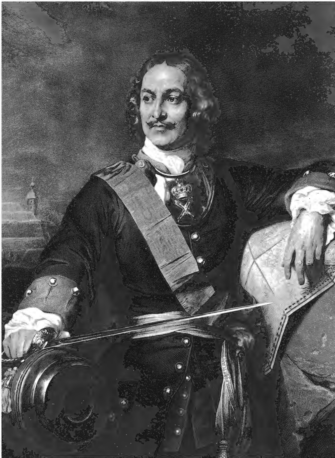
ИМПЕРАТОРЪ ПЕТРЪ I.