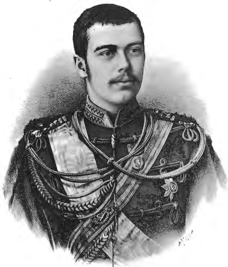
ЕГО ИМПЕРАТОРСКОЕ ВЫСОЧЕСТВО, НАСЛѢДНИКЪ ЦЕСАРЕВИЧЪ И ВЕЛИКІЙ КНЯЗЪ НИКОЛАЙ АЛЕКСАНДРОВИЧЪ.