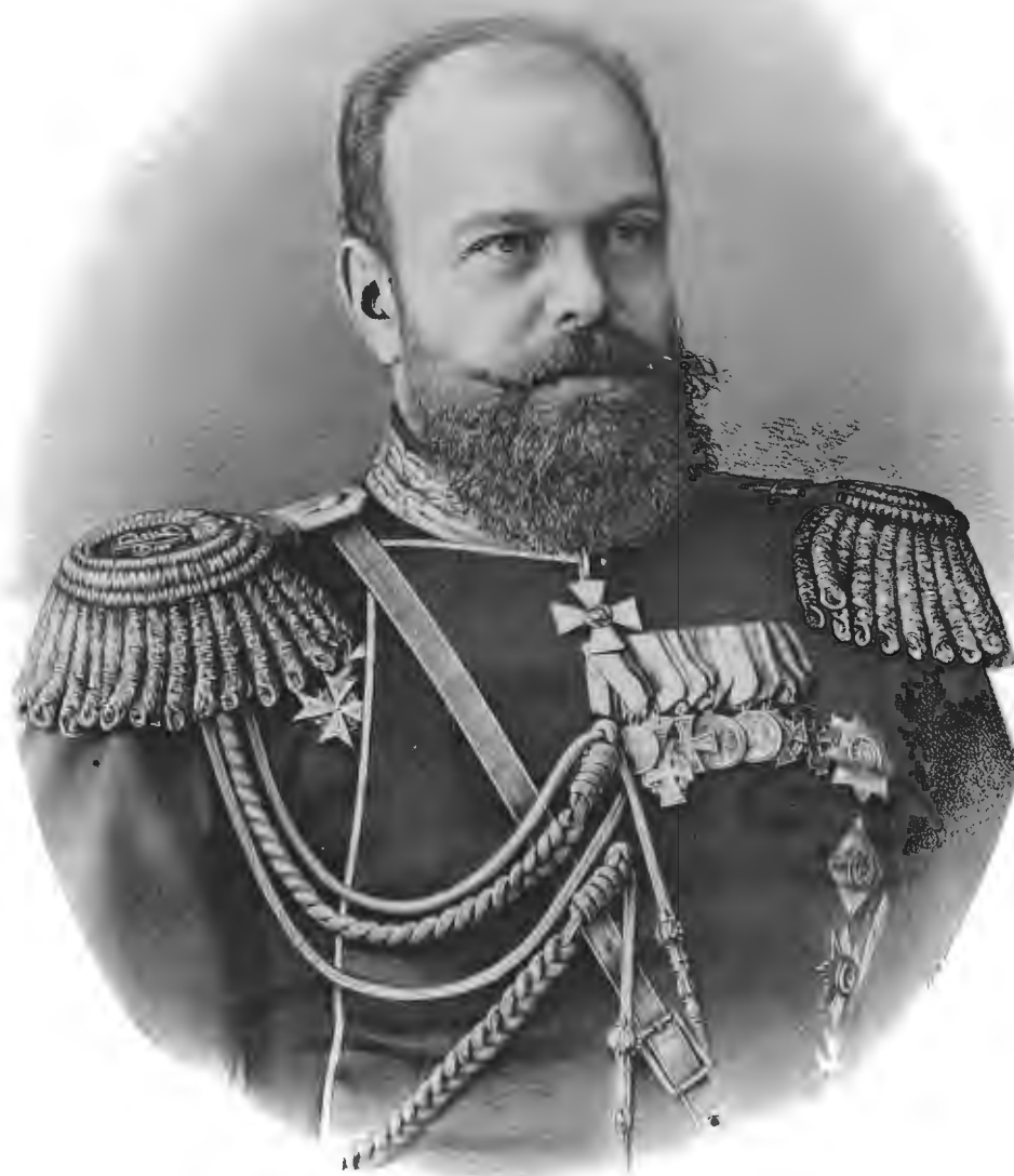
ЕГО ИМПЕРАТОРСКОЕ ВЕЛИЧЕСТВО, ГОСУДАРЬ ИМПЕРАТОРЪ АЛЕКСАНДРЪ АЛЕКСАНДРОВИЧЪ. САМОДЕРЖЕЦЪ ВСЕРОССИЙСКІЙ.